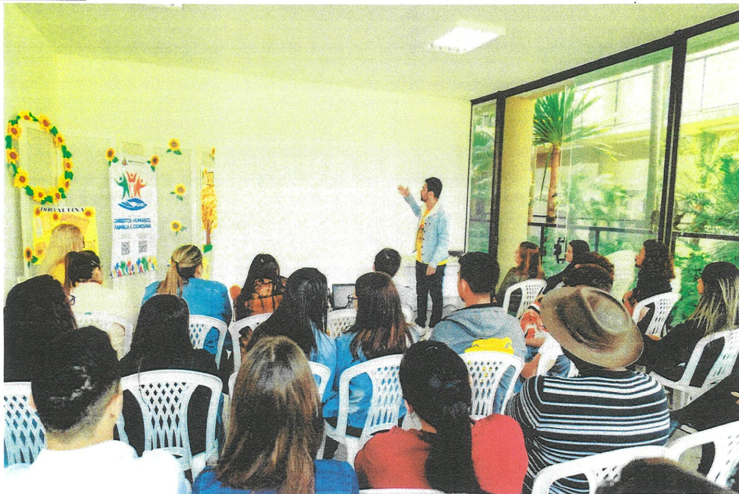
Evento teve como público-alvo os estagiários da Prefeitura de Tatuí.

A Prefeitura de Tatuí, por meio da Secretaria de Direitos Humanos, Família e Cidadania, realizou,