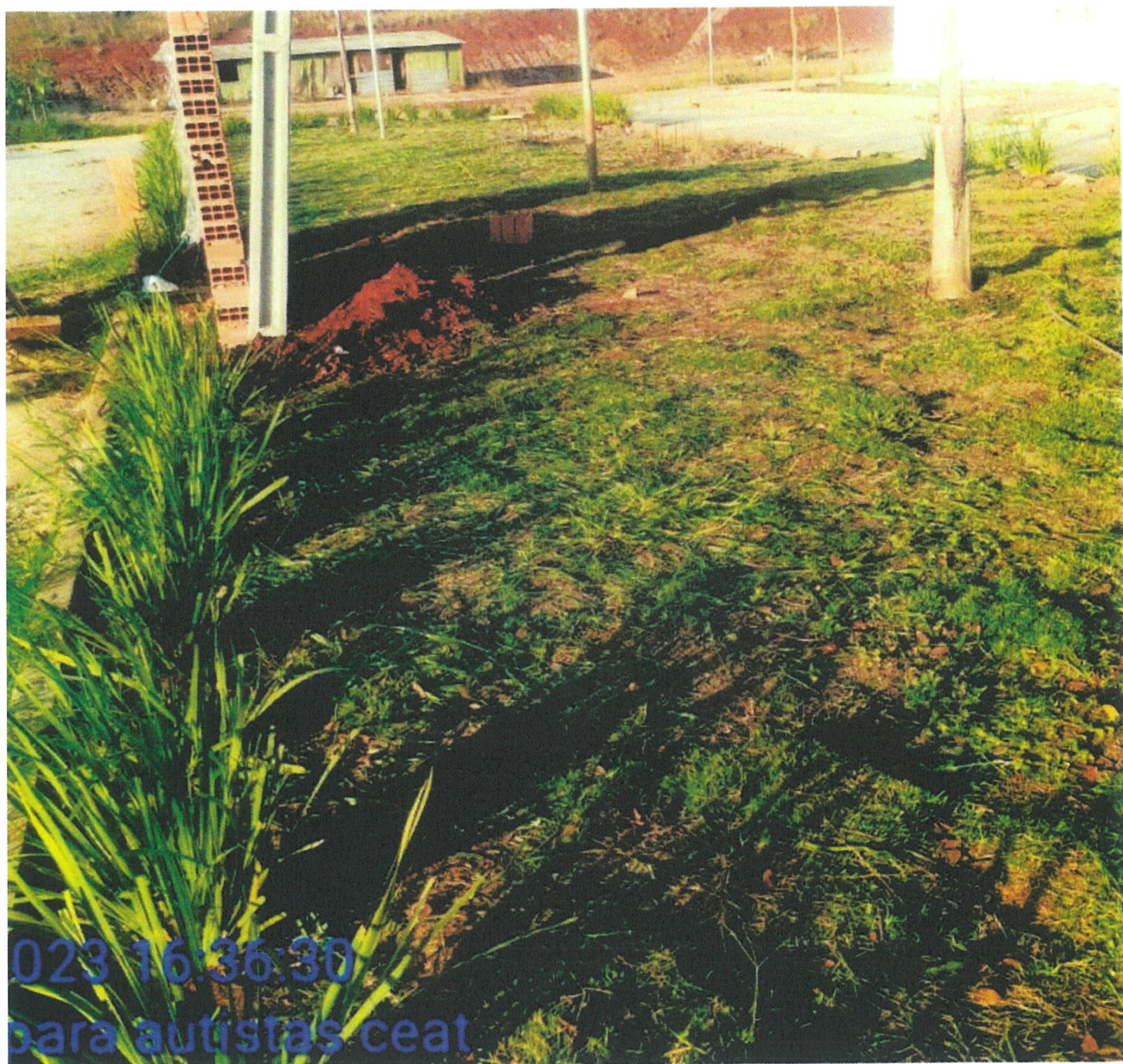
Área externa - depois