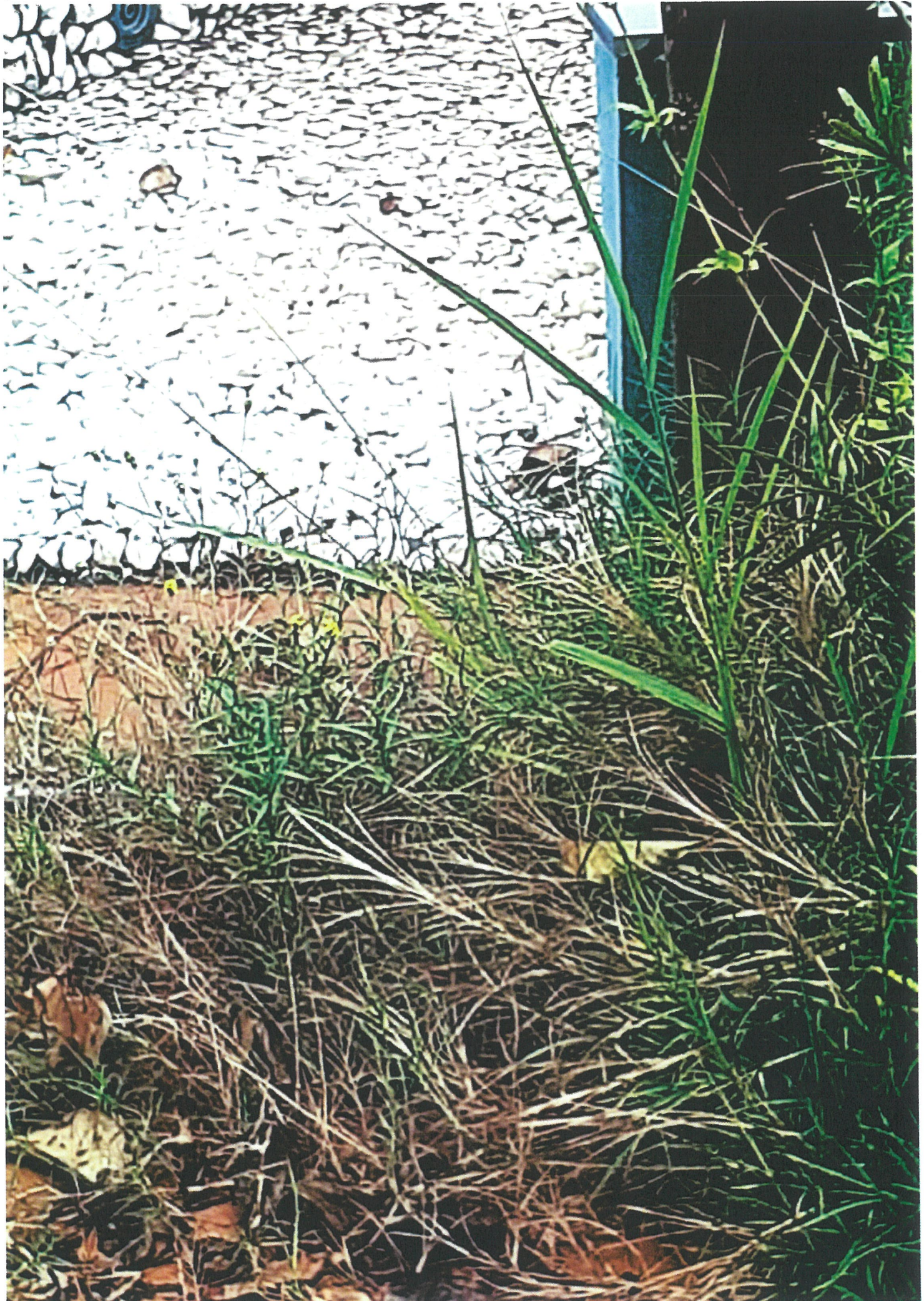
Handwritten text at the bottom of the page, possibly a date or description, which is mostly illegible due to blurring.