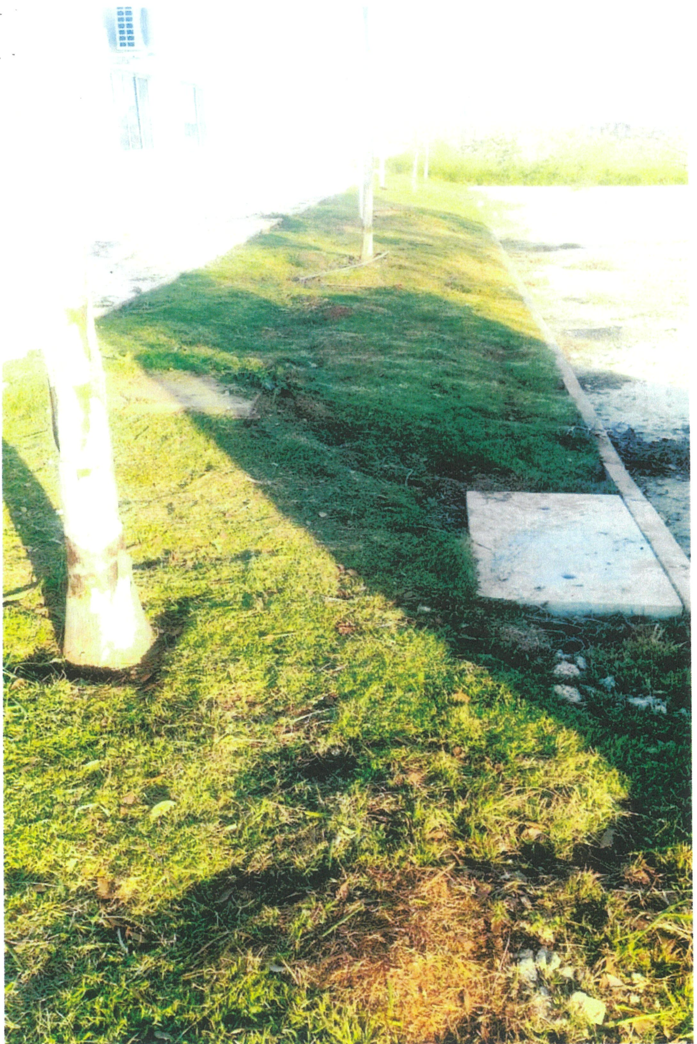
View exterior bridge