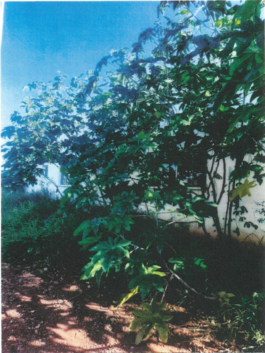
Área externa - Antes