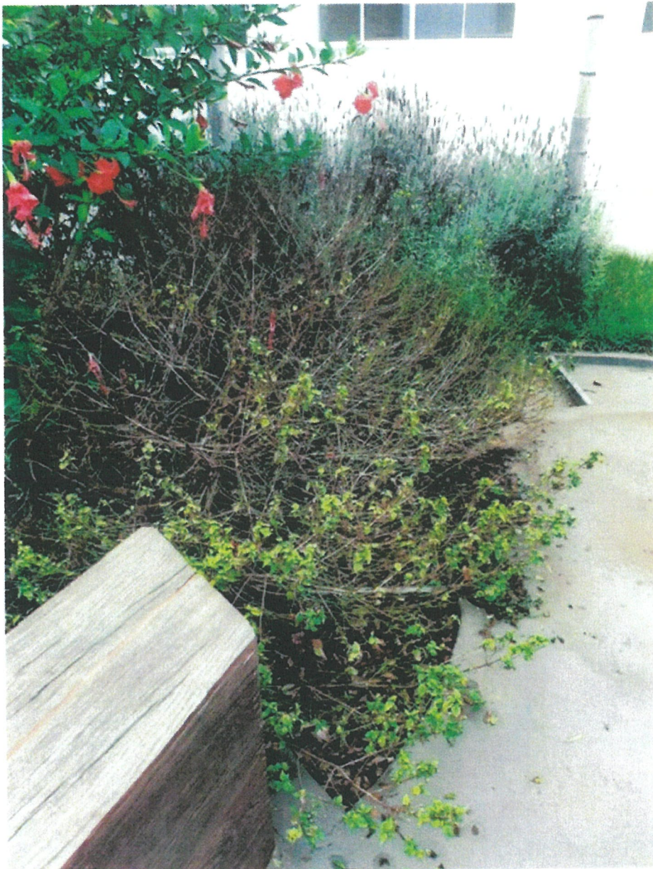
Jardim sensorial - antes