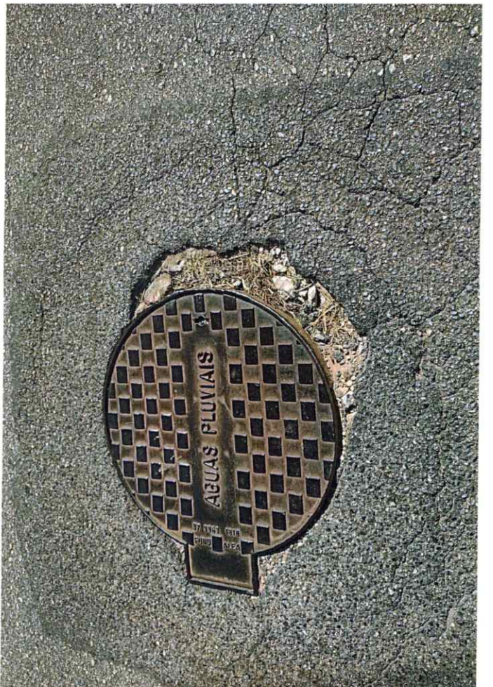
Alameda mantovani, nº 10285 - Ofício 035/2024 RmST.