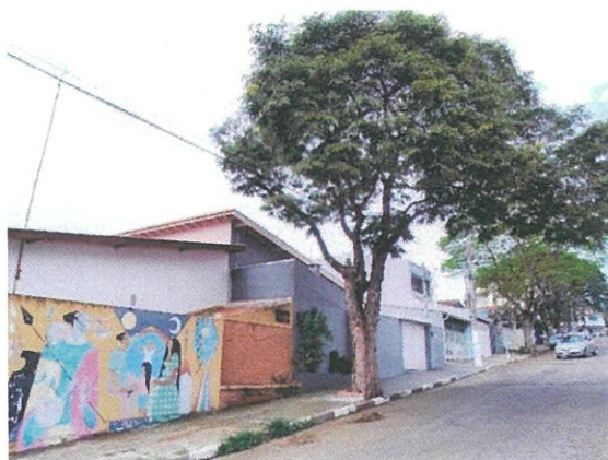
Registro fotográfico: Agosto de 2023

Anexamos abaixo imagem de Agosto/23 durante a vistoria do processo e outra de Fevereiro/24, já após a poda realizada para aprimoramento.