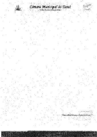
283-Marquinho.JPG 717 KB

Avenida Cônego João Clímaco, 140 Centro - Tatuí/SP - 18270-900 Fone: (15) 3259.8421