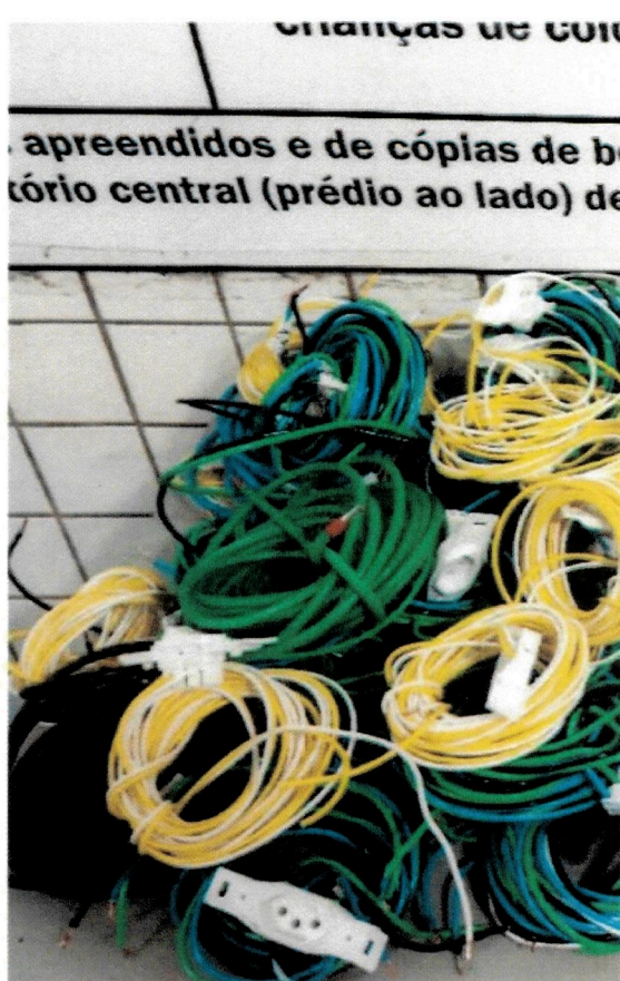
Enviado do meu iPhone